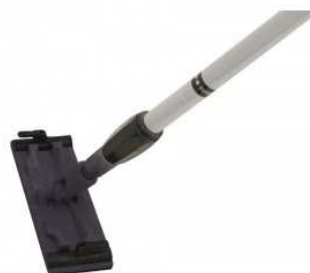
Taloche abrasive adaptable sur perche télescopique.