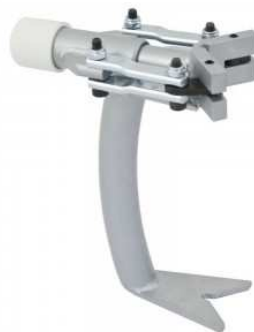
Scie à guichet 150 mm à double denture et fourreau.