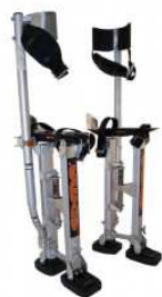
Echasses de plaquiste.