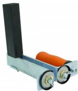
Mini rabot pour plaque de plâtre. 160-290 cm.