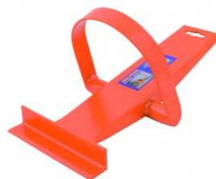
Lever à plaque avec étrier en acier.