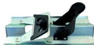
Scie à guichet 250 mm à double denture et fourreau.