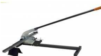
Guillotine professionnelle pour profilés métalliques jusqu'à 125 mm de large.