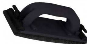
Taloche abrasive manuelle.