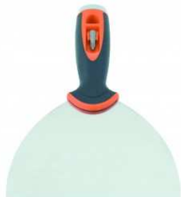
Couteau à enduire américain avec embout de vissage amovible.