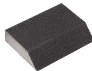
Eponge abrasive angulaire.