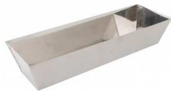
Bac à enduire.