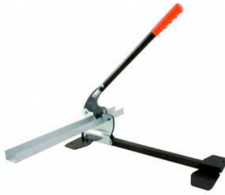
Guillotine à profilés métalliques.