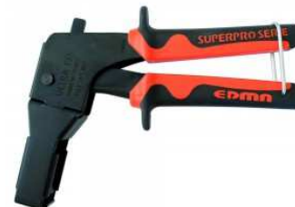
Pinces d'expansion des chevilles métalliques universelles.