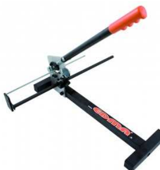
Coupe tiges filetées et fils de suspente.