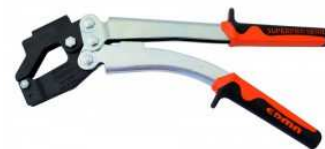
Pince à sertir tous types de rails et montants.