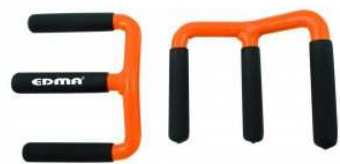
Transporteurs de plaques à griffes.