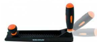
Rabot pour plaque de plâtre et bois.