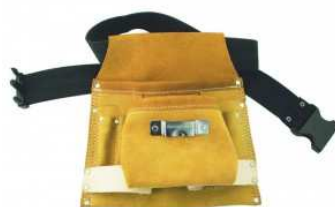
Poche à outils.