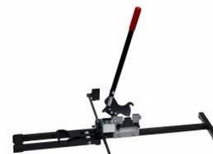
Guillotine à rails, montants et tiges filetées.