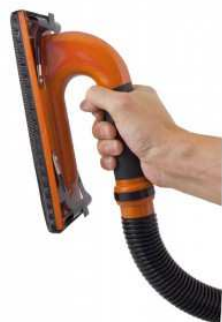
Ponceuse adaptable sur aspirateur.