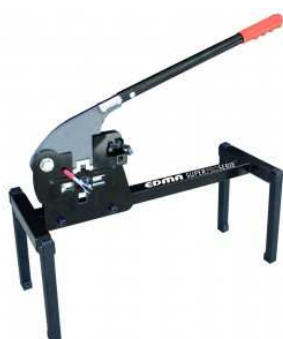
Guillotine professionnelle pour profilés métalliques.