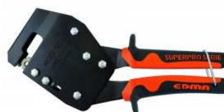
Pince à sertir les rails et montants à une main.