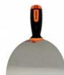
Couteau à reboucher.