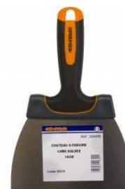
Couteau à enduire à lame galbée.