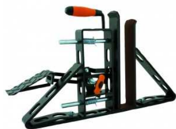
Cale de maintien vertical de la plaque de plâtre.